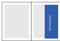
1/2 полосы (ч/б)