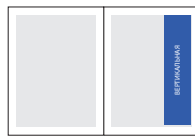
1/4 полосы (ч/б)