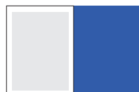
обложка, 1/1 полосы